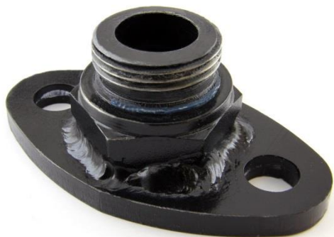
BLD10930 DIN 42567 Adaptateur BSP(m)