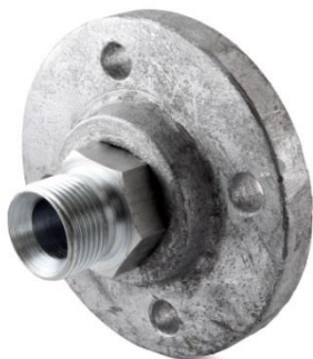
BLD11915 Adaptateur de 1" PNG à 3/4" BSP(m)