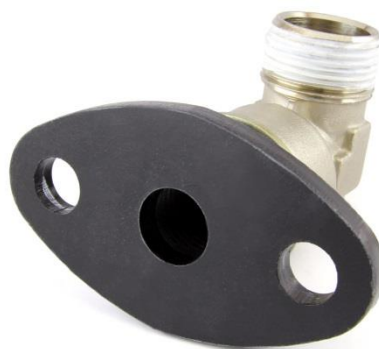
BLD10996 Adaptateur coudé de DIN SPEC 42567