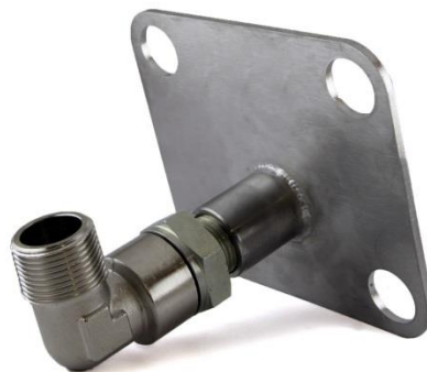
BLD11103 Adaptateur coudé 3/4" BSP(m)