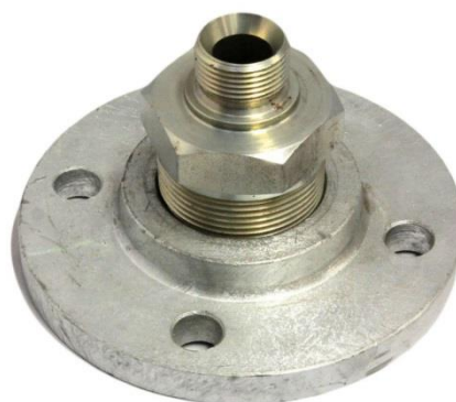
BLD12213 Adaptateur de 3/4" BSPP(m) à DN40 PN6