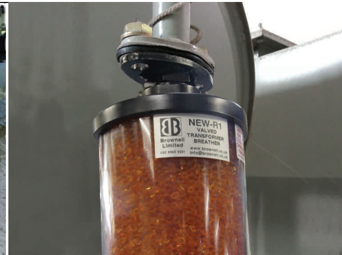
Nouvel assécheur avec sa bride DIN.