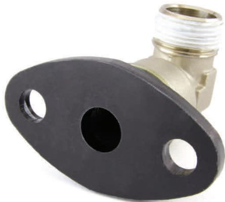
BLD10996 Adaptateur coudé DIN 42567