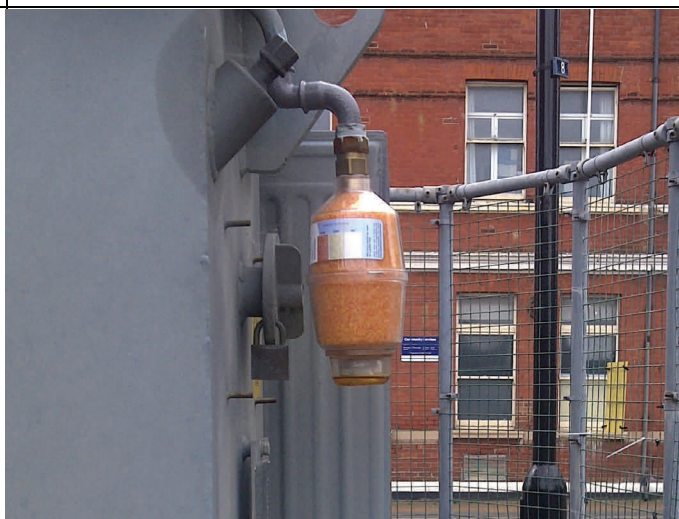
Ancien assécheur difficile à recharger.