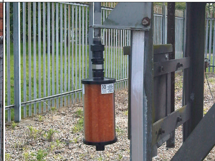
Nouvel assécheur avec bride DIN.