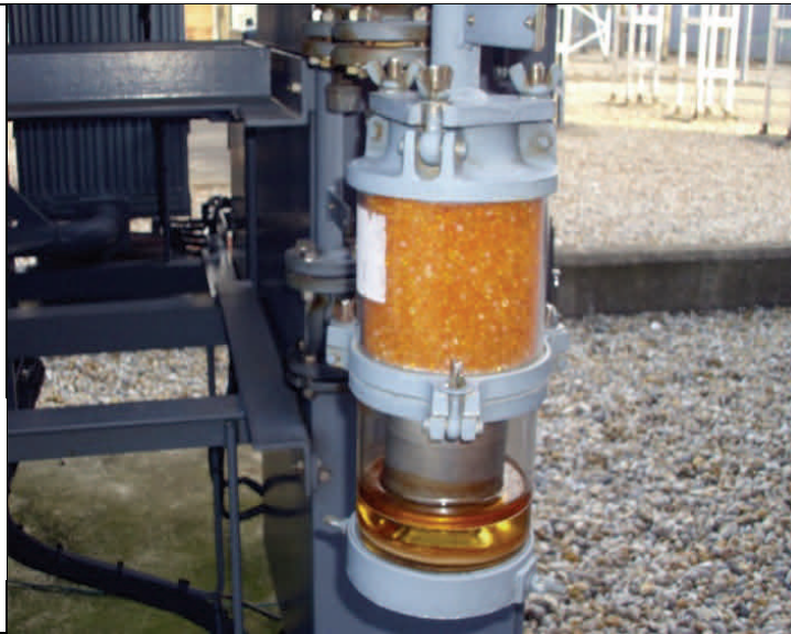
Ancien assécheur avec bride DIN42562.

Adaptateur triangulaire de 3/4" BSP(f) à DIN SPEC 42562