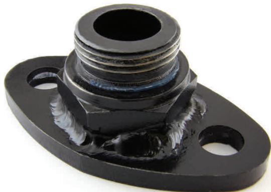
BLD10930 Adaptateur DIN 42567 BSP(m)