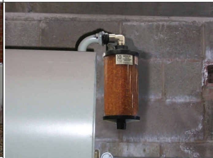
Nouvel assécheur R1 avec sa bride DIN.