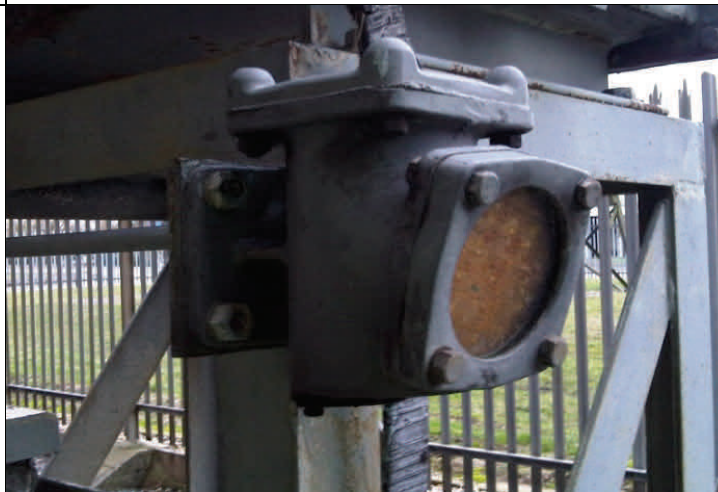
Ancien assécheur difficile à recharger.