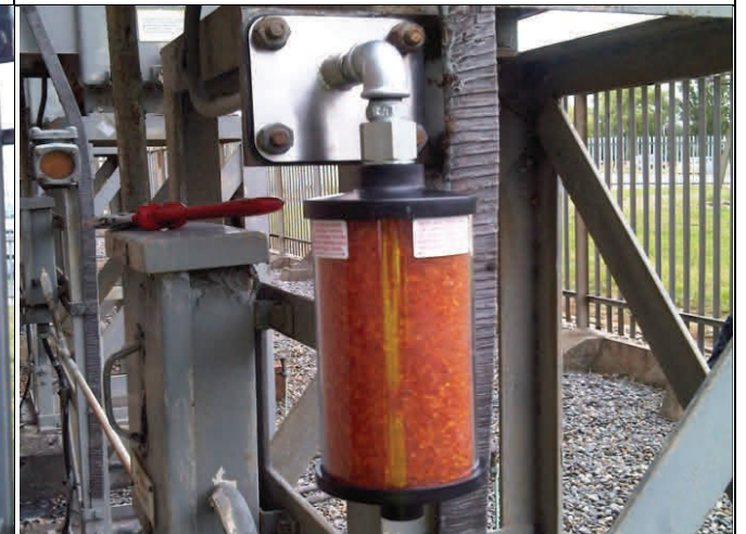
Nouvel assécheur avec sa bride.