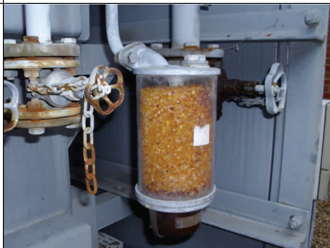
Ancien assécheur difficile à recharger.