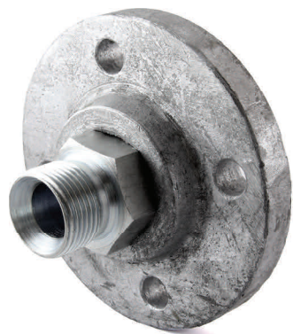
Adaptateur de 1" PNG à 3/4" BSP(m)