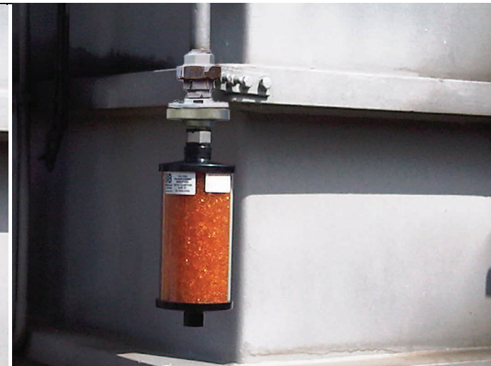
Nouvel assécheur avec bride DIN.