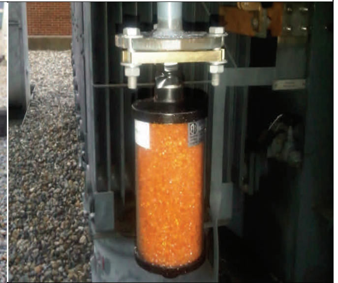
Nouvel assécheur R1 avec bride DIN42562 flange.