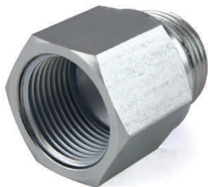
BLD8464 Adaptateur de 3/4" BSP(f) à 3/4" BSP(m)