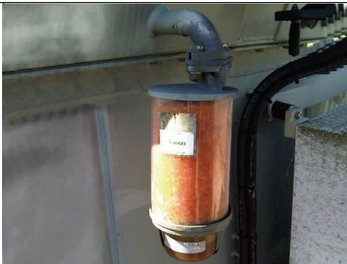
Ancien assécheur difficile à recharger.